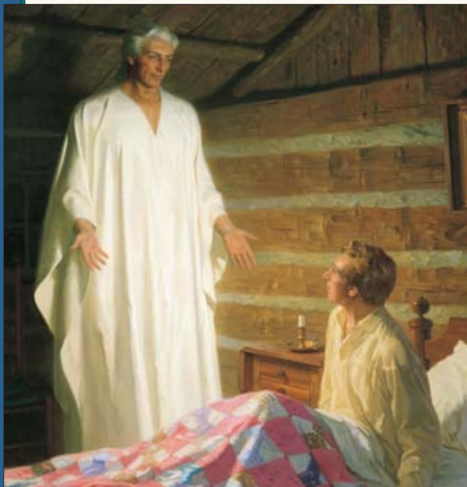
Tre år efter Joseph Smiths första syn sände Gud ängeln Moroni för att undervisa Joseph om hur han skulle återställa Jesu Kristi evangelium.

När jag på aftonen ovannämnda dag, den tjugoförsta september, hade dragit mig tillbaka och gått till sängs, tog jag min tillflykt till bön och åkallan om den allsmäktige Gudens förlåtelse för alla mina synder och dårskaper samt även att han skulle tillkännage för mig, hur min ställning och mitt förhållande var inför honom, ty jag trodde säkert, att jag skulle få en gudomlig uppenbarelse, liksom jag tidigare fått.