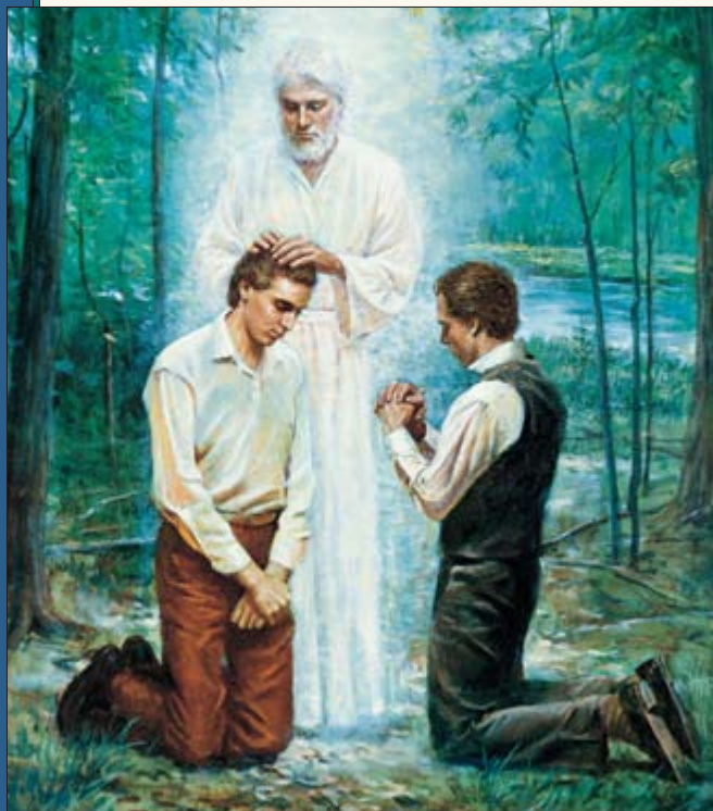
Joseph Smith och Oliver Cowdery fick aronska prästadömet genom handpåläggning av Johannes Döparen den 15 maj 1829.

"I Messias' namn giver jag eder, mina medtjänare, Arons prästadöme, som innehar