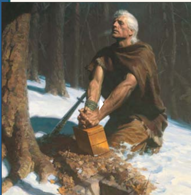
År 421 e Kr grävde profeten Moroni ner heliga uppteckningar om sitt folk i kullen Cumorah. När han senare återvände som uppstånden person, berättade han för Joseph Smith om den forntida urkunden, som innehåller evangeliets fullhet så som Frälsaren gav det till de forntida invånarna på den amerikanska kontinenten. Denna urkund är Mormons bok.

Efter det att han hade sagt detta, började han att citera profetiorna i Gamla testamentet. Han citerade först en del av Malakis tredje kapitel och också samma profetias fjärde eller sista kapitel, fastän med en liten avvikelse från texten i Bibeln. I stället för att citera första versen som den står i våra böcker, citerade han den så här: