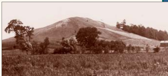
Kullen Cumorah ligger cirka 5 kilometer sydost om familjen Smiths gård i Palmyra i New York. På Josephs tid var norra delen täckt av gräs, den södra av gles skog. Plåtarna låg nergrävda på sydvästra sidan, ganska nära kullens krön. Foto taget i augusti 1907.

De intryck som allt detta gjorde på mitt sinne, var nu så djupa, att all sömn hade flytt från mina ögon, och jag låg där överväldigad av vad jag både sett och hört. Men hur stor var inte min förvåning, när jag åter såg samma budbärare vid min sida och hörde honom på nytt upprepa detsamma som han förut sagt till mig! Han tillade en varning. Han sade, att Satan skulle försöka fresta mig (till följd av min fars familjs små omständigheter) att försöka komma i besittning av plåtarna för att bli rik. Han förbjöd mig detta och sade, att jag inte fick ha något annat för ögonen, när jag erhöll plåtarna, än att förhär-liga Gud. Någon annan bevekelsegrund än