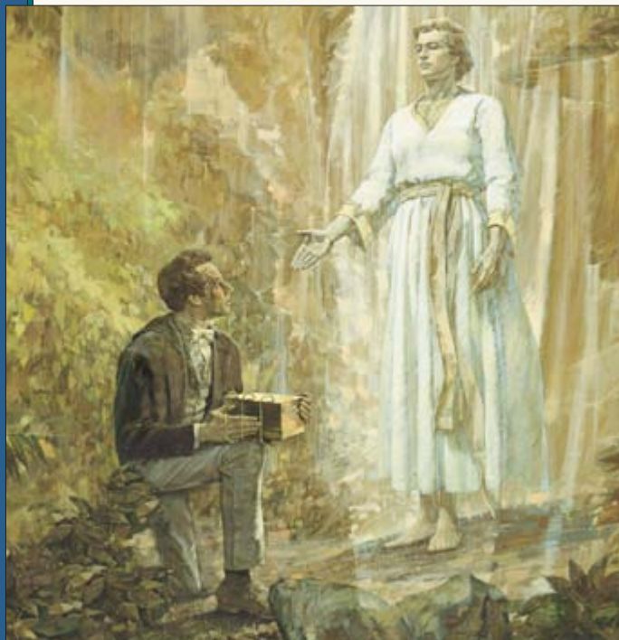
Moroni kom tillbaka en gång om året i fyra år och gav den unge profeten ytterligare undervisning. Efter dessa fyra år fick Joseph plåtarna och började översätta Mormons bok.

då jag försökte att arbeta som vanligt, fann jag, att min styrka var så försvagad, att jag inte kunde göra det. Min far, som arbetade tillsammans med mig, upptäckte att något fattades mig, och bad mig att gå hem. Jag började gå hemåt, men när jag skulle kliva över en gårdsgård för att