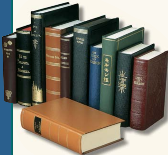
Mormons bok, som trycktes första gången år 1830, ges för närvarande ut på mer än 80 språk världen över.

För en mer fullständig redogörelse för Joseph Smiths berättelse, se Joseph Smiths skrifter, 2 i Den kostbara pärlan eller History of the Church, 1:2–79.