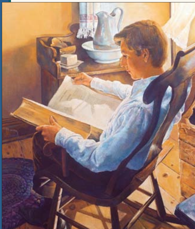
Då Joseph skulle bestämma sig för vilken kyrka han skulle ansluta sig till, sökte han ledning i Bibeln. Där läste han: "Be till Gud."

Från och med den dagen arbetade Joseph i Guds tjänst för att upprätta Jesu Kristi Kyrka av Sista Dagars Heliga och för att bygga upp Guds rike på jorden i de sista dagarna. Trofasta medlemmar i kyrkan vittnar om att Jesus Kristus är världens Frälsare och Återlösare. Jesus leder sin kyrka i dag genom uppenbarelse till en profet på jorden. Joseph Smith var en