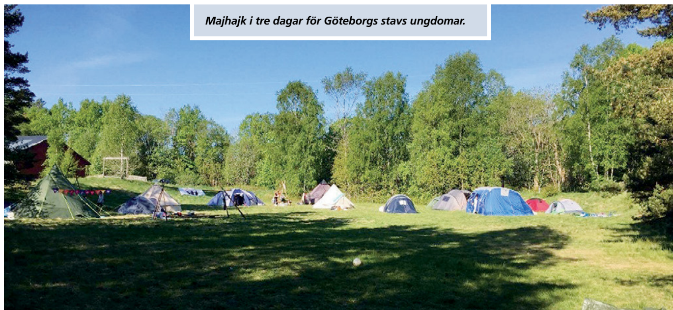
Majhjk i tre dagar för Göteborgs stavs ungdomar.

Med andra ord: Det hade omöjligt kunnat bli bättre än så här! Stort tack till alla deltagare och de många ledare som var med och hjälpte till att göra detta till en oförglömlig upplevelse. ■