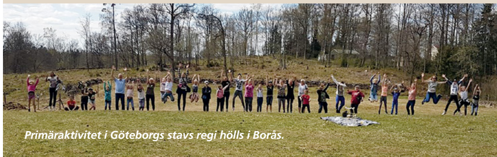
Primäraktivitet i Göteborgs stavs regi hölls i Borås.

Dagen var mycket uppskattad. En av deltagarna kallade den för en mini-UMUK-dag och tyckte att det gav en försmak av UMUK. Jag tror att detta kan bli en ny tradition i Göteborgs stav. ■