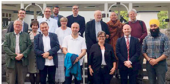
Sveriges interreligiösa råd möttes på tempelområdet.