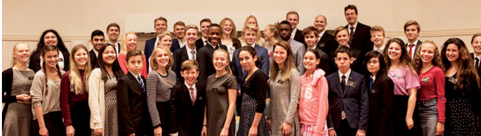
Ungdomarna i Stockholms södra stav samlade till en MTC-dag

och ett avslutande vittnesbördsmöte. Det var ett fint och andligt möte!